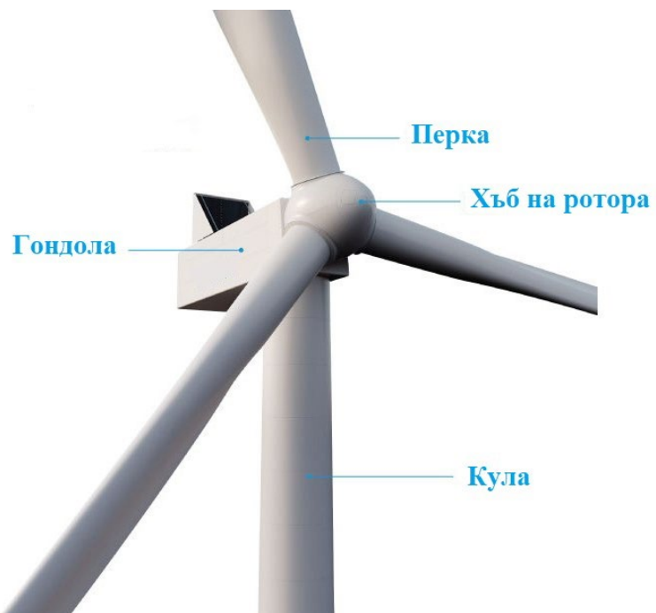
Фиг. 3. Схема на вятърен генератор с хоризонтална ос